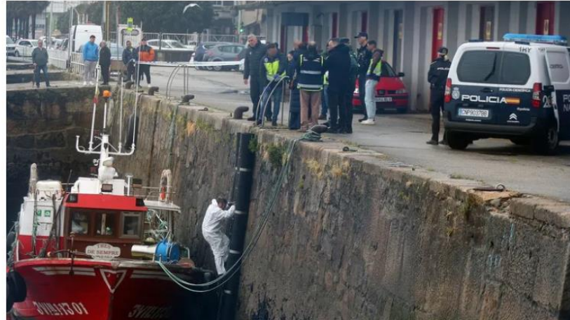
El cuerpo apareció encadenado a una escalinata, entre un barco y el muelle. CARMELA QUEIJEIRO

Por el momento se están recabando todas las pruebas posibles para esclarecer el caso. En el puerto ribeirense existen cámaras de seguridad , pero llevan años sin funcionar. Hay una que sí está operativa de la Autoridad Portuaria y, precisamente, tiene en su rango el lugar en el que se encontró el cuerpo del hombre. La Policía Judicial ya solicitó las imágenes para analizarlas y comprobar si la grabación puede arrojar algo de luz a este suceso.