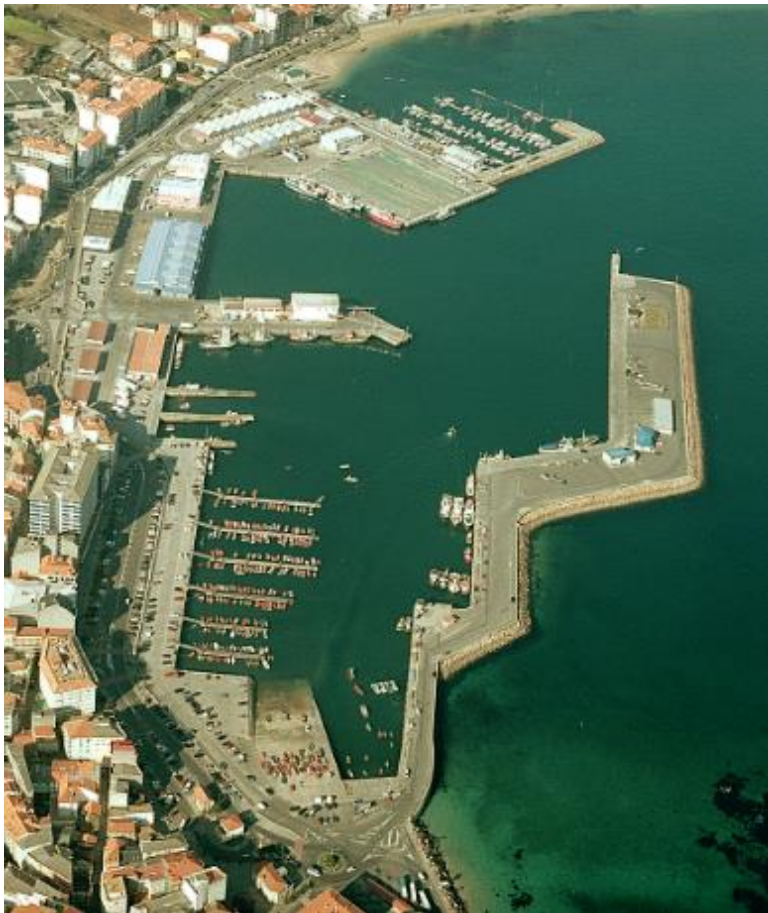
Porto de Ribeira